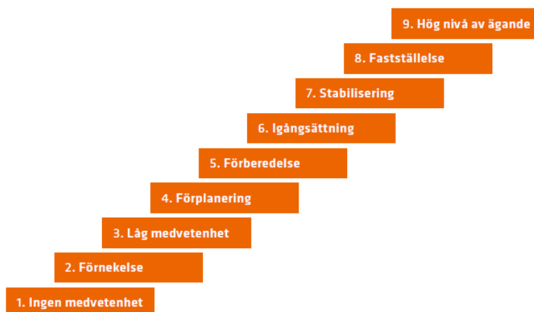
Figur 3. Community Readiness Model, CRM, en niogradig skala för bedömning av förändringsbenägenhet

Arbetet med barnrättsintegrering, ser olika ut i kommunen. Så också förändringsbenägenheten för att utveckla arbetet med att aktivt stärka respekten, skyddet och främjandet av barns mänskliga rättigheter. Grunden i projektet har utgått från verksamheters positionering i förändringsprocessen och därifrån undersöka vilka behov som finns för att utveckla ett systematiskt arbetssätt. Community Readiness Model (se figur 3) beskriver i nio steg var i förändringstrappan en verksamhet och dess ledande aktörer befinner sig när det gäller ett specifikt ämnesområde 14 . Det processinriktade förhållningssättet som utgör barnrättsarbetets grund, förutsätter att hänsyn tas till modellen. Vid avslut av projektet bedömer representanterna i den strategiska barnrättsgruppen att kommunen som helhet befinner sig på stegen 4-6. Representanterna rapporterar generellt en ökad förändringsbenägenhet under projektperioden vilket även bekräftas i projektets resultat.