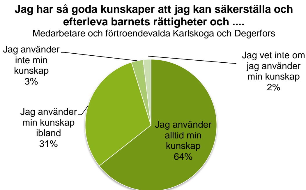
Figur 2. Relationen mellan självrapporterad god kunskap om barnets rättigheter och frekvens i tillämpning.

rapporterar att de alltid använder sina kunskaper om barnets rättigheter i praktiken jämfört med män. Inspiration, konkreta tips, kunskap, tydlig styrning och tid är förutsättningar för att kunna omsätta barnets rättigheter i verkligheten. I figur 2 presenteras sambandet mellan god kunskap om barnets rättigheter och i vilken utsträckning kunskapen används.